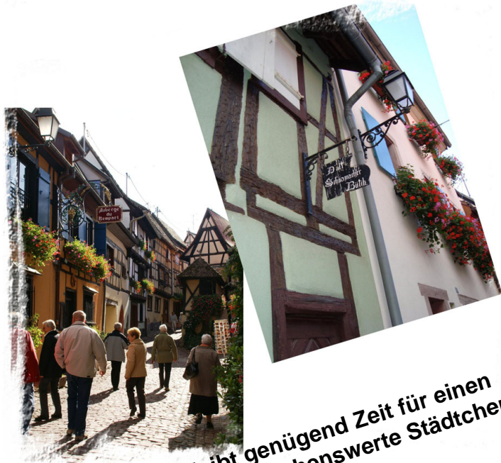
In Eguisheim bleibt genügend Zeit für einen Rundgang durch das sehenswerte Städtchen.